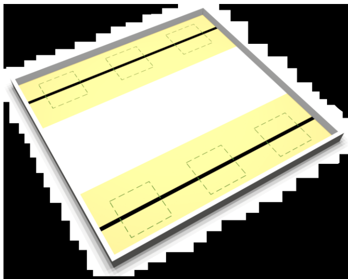
Рисунок 1. Игровое поле