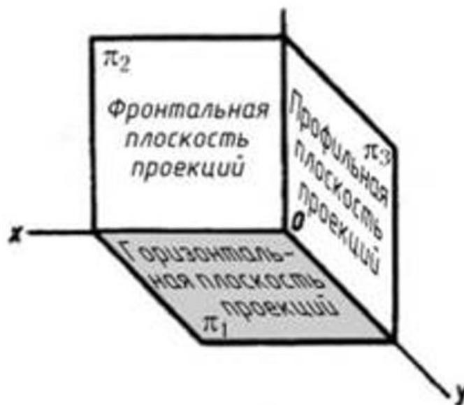
Рис. 1. Наименование плоскостей

Конструкция робота не должна позволять захватывать мяч. Захватом мяча считается перекрытие более 50% мяча проекцией робота в горизонтальной или профильной плоскости проекции с обеих сторон в любой момент времени.