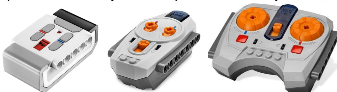
Рисунок 2. «Примеры распространенных ИК-пультов»