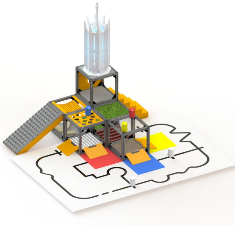
Рисунок 1. «Общий вид конфигурации полигона»