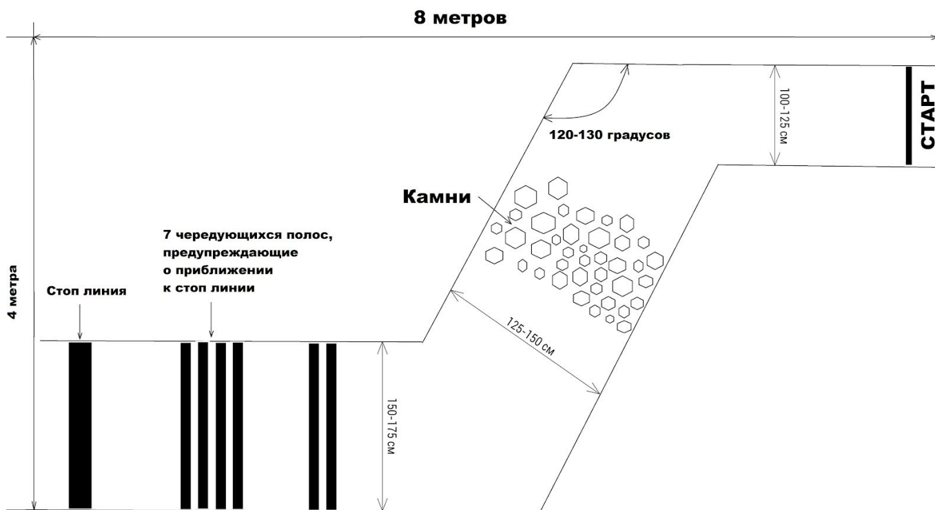
Рис. 1. Конфигурация полигона.

В кадре должны присутствовать участники команды. Длительность видео не должна превышать двух минут.